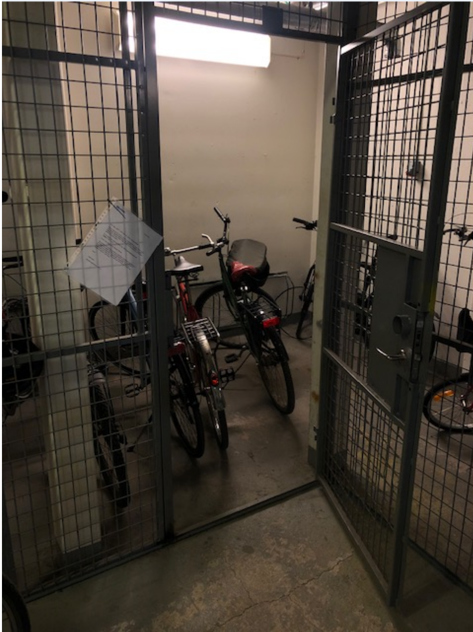
Så kan det se ut på morgonen när man hämtar cykeln